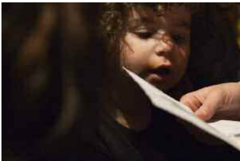
Des Roms déplacés internes du Kosovo, qui se sont rendus à Belgrade juste après la fin du conflit au Kosovo en 1999

L'UE devrait s'appuyer sur ses engagements politiques et prendre des mesures concernant les cas d'expulsions forcées, les cas de ségrégation dans le domaine de l'éducation, les agressions racistes et les discours de haine. Parmi les engagements importants pris par la présidence tripartite figurent le rappel de la dimension des droits fondamentaux et la nécessité de garantir la sécurité personnelle et la protection des Roms contre la discrimination. Cependant, l'action de l'UE ne peut avoir un réel impact que si elle est élaborée dans le cadre d'une stratégie globale et cohérente de promotion de l'inclusion des Roms.