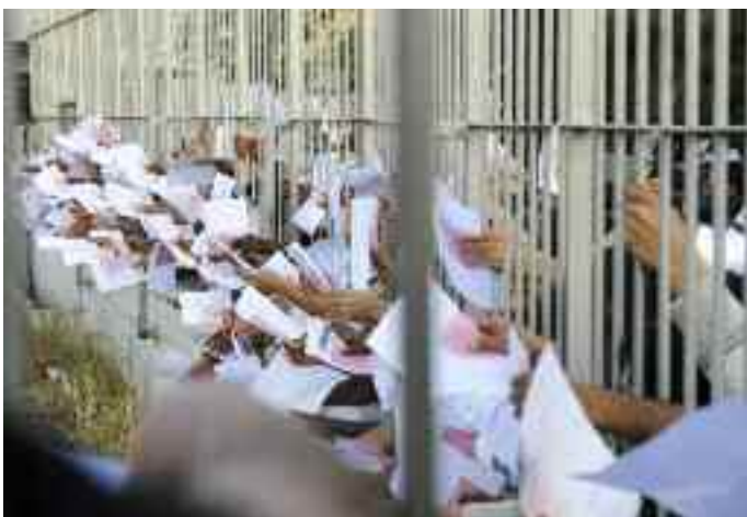
Des demandeurs d'asile attendent pour déposer leur formulaires de demande d'asile, à l'entrée du Département Asile, Politique, Direction des Etrangers, Athènes, Grèce

Allouer des ressources suffisantes au BEAA afin qu'il puisse mener sa mission principale visant à assurer des conditions égales pour tous en ce qui concerne la protection accordée par tous les États membres de l'UE, et impliquer les organisations de la société civile dans les questions relevant du mandat du BEAA. Veiller également à ce que toutes les informations pertinentes sur cet organisme soient accessibles.