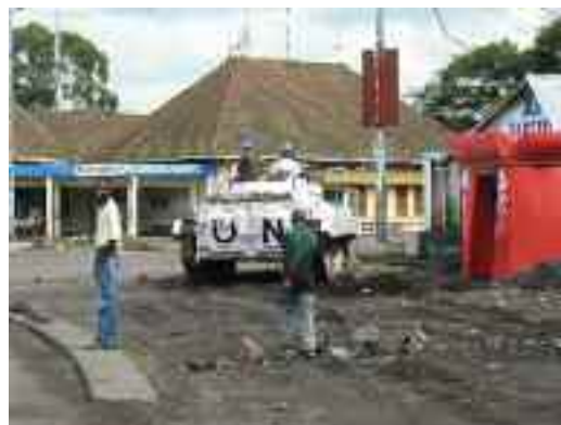
Un transporteur de la Monuc (Nations Unies) dans une rue de Goma, en République Démocratique du Congo

Au Burundi, des partis d'opposition se sont vus interdire le droit de tenir des réunions. Par ailleurs, des informations ont fait état d'incidents violents ayant opposé des membres du parti au pouvoir et des partis d'opposition avant les élections. Au Rwanda, les autorités ont utilisé des dispositions législatives réprimant l'idéologie du génocide qui étaient rédigées en termes vagues pour museler les opposants, notamment ceux qui critiquaient le parti au pouvoir et qui réclamaient justice pour les crimes de guerre. De même, Amnesty International craint que des opposants politiques en Ouganda ne soient victimes de violations des droits humains comme cela a été le cas dans le passé. De plus, les forces de sécurité de ce pays ont eu recours à des arrestations arbitraires, des détentions illégales, à la torture et à d'autres formes de mauvais traitements afin d'empêcher la tenue de réunions et de rassemblements. Toujours en Ouganda, une proposition de loi permettant au gouvernement d'exercer une surveillance discrétionnaire risque de menacer gravement le respect du droit à la vie privée et la liberté d'expression. Celle-ci a également été limitée par l'adoption en 2009 d'une loi contre l'homosexualité, qui réprime encore davantage l'homosexualité.